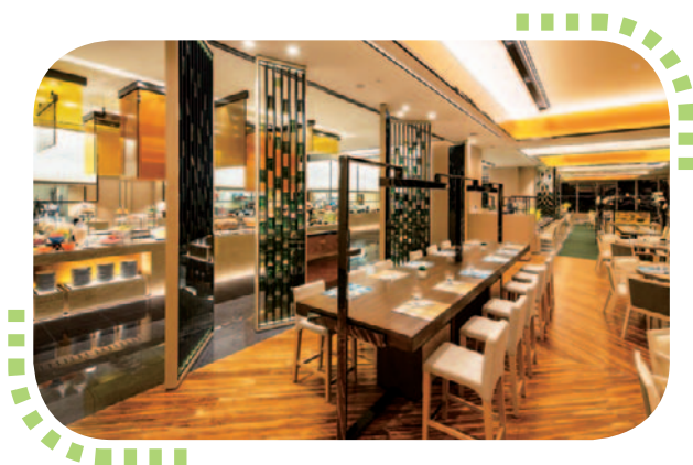
「蒼景」餐廳獲頒 LEED 金級及「綠建環評」銀級綠色建築認證。

在本港以外，本集團位於中國內地的電廠均實施ISO 14001環境管理體系，並已提升發電機組，以減少煤耗和碳排放。此外，澳門水廠與澳門大學合作研發一組「低成本及低損耗電流質量補償省電裝置」，此裝置有助減少水廠水泵的用電量，發揮減排及降低成本的效用。