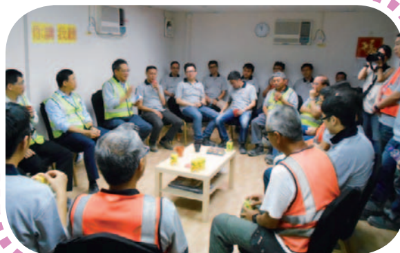
協興管理層與前線工人的雙向溝通，有助提高安全意識。

我們要求供應商及承辦商遵守母公司新世界發展所訂立的《供應商守則》，並須受當中所列明的道德、社會及環保規定約束。以我們的建築業務為例，其業務性質的環境及社會風險相對較高，因此，協興建築有限公司（「協興」）、惠保（香港）有限公司及新世界建築有限公司在甄選供應商及承辦商時，會同時考慮各公司的品質管理、環境及能源管理、安全管理及社區投資等方面的表現因素。