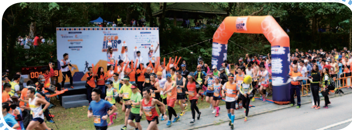
「新創建勇跑地貌王」賽事錄得約1,500名人士參與，一同推廣強身健體的訊息，並宣揚香港瑰麗的自然地貌。

新創建集團在2016財政年度首辦「新創建勇跑地貌王」賽事，推廣健康生活及地質保育。是次活動賽道毗鄰香港世界地質公園，吸引了約1,500名跑手參與半馬拉松及10公里組別賽事。為促進社會共融，並讓弱勢社群體驗活動，賽事設有兩公里「英雄勇跑賽」，邀請了八間非牟利機構逾百名服務對象參與。「新創建勇跑地貌王」是「新創建香港地貌行」計劃的主要活動，其他活動包括為高中生而設的全年地質保育培訓，以及公眾導賞團和清潔地質公園活動。