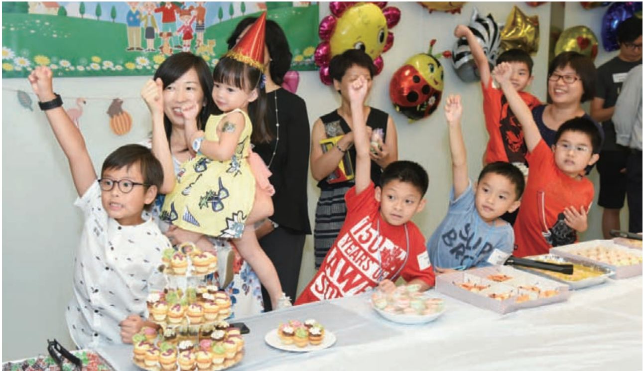
員工子女在家庭參觀日參與互動遊戲。

人才是本集團最珍貴的資產，亦是營商賴以成功的動力，令業務取得佳績，並能提升營運效益。我們積極招攬及挽留傑出人才以壯大團隊，因應配合的人才發展方針涵蓋拓展招聘平台、提供具競爭力的薪酬福利、促進員工培訓及事業發展，以及提倡生活與工作平衡。與此同時，各大業務致力建立安全、包容及關愛的工作環境。