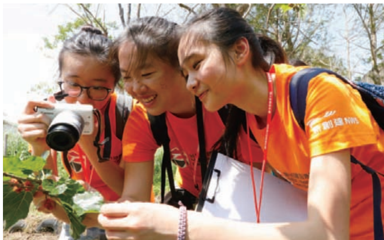
青年地質保育大使細心觀察位於台東的獨有生態。

「新創建香港地貌行」另一項深受歡迎的「新創建勇跑地貌王」，讓跑手在本港世界地質公園競賽，連同多個於本港離島舉行的公