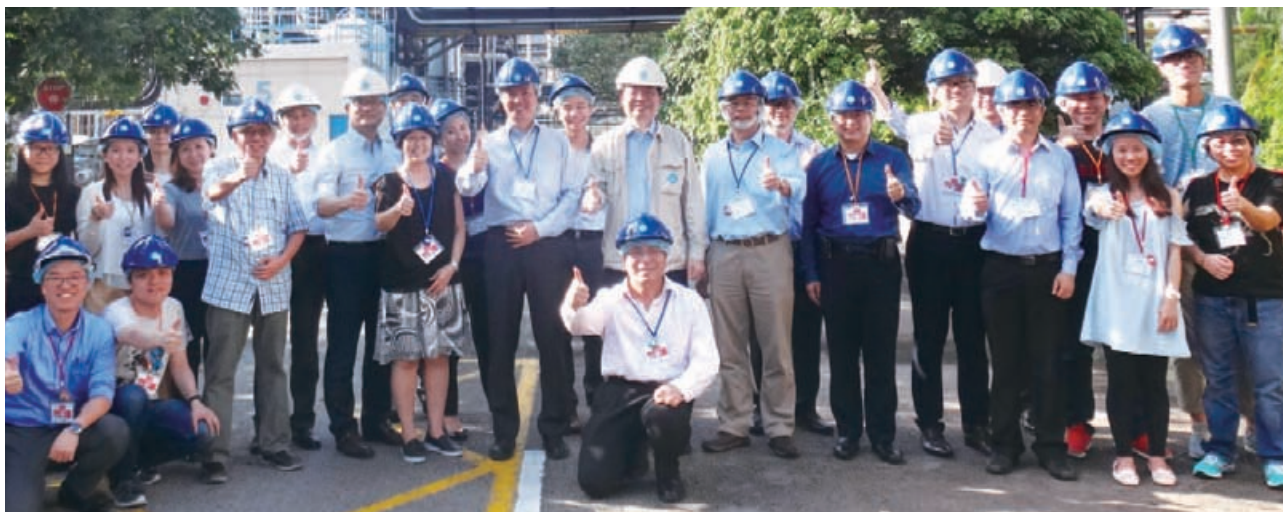
本集團管理層及環保經理考察環保項目以吸收新知識。