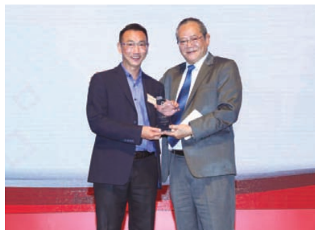
環保表現卓越的建築分判商獲嘉許表揚。