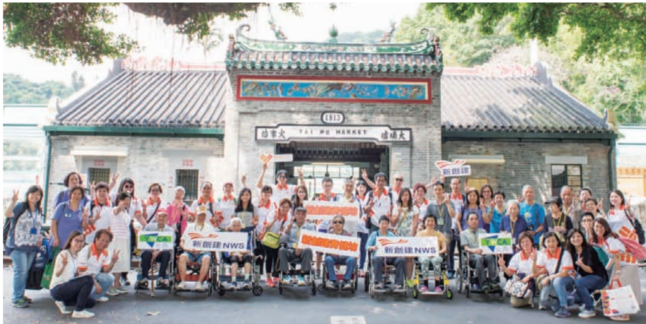
企業義工陪同長者參觀大埔香港鐵路博物館。

本集團持續與女青年會合作推動義工服務，於2017年3月推出為期兩年，名為「『認知無障礙』長者友善社區關愛計劃」，期間會以家訪、社區活動及教育短片等形式，加深公眾對常見長者健康問題的認識。