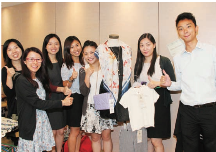
新創建集團總辦事處舉辦「裳」綠市集，向員工推廣可持續的穿衣之道。

2017財政年度的員工環保活動以「可持續採購和消費」為主題，推動員工在工作和日常生活中實踐可持續的消費模式。除了安排環保經理考察煤氣生產廠房外，我們還舉辦了一系列的輕鬆活動，推廣可持續消費及生活習慣。