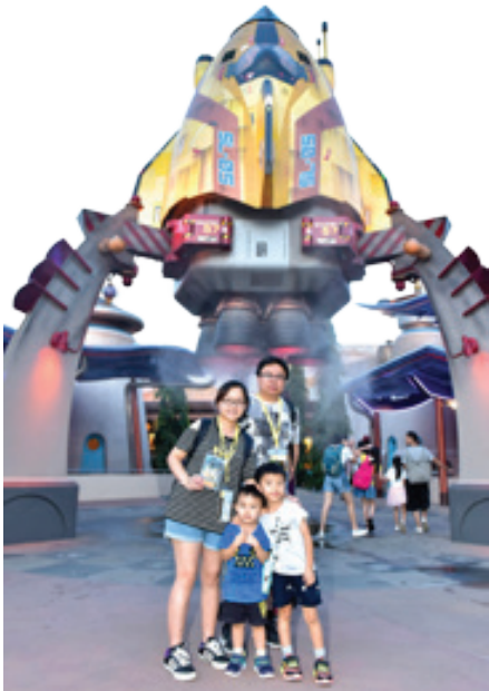
逾8,000名本地員工及其家屬享受香港迪士尼樂園之旅，共敘天倫。